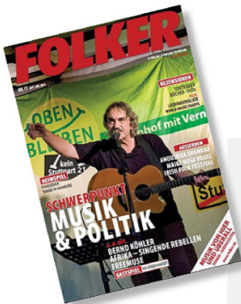
FOLKER Sept. - oct. 2013