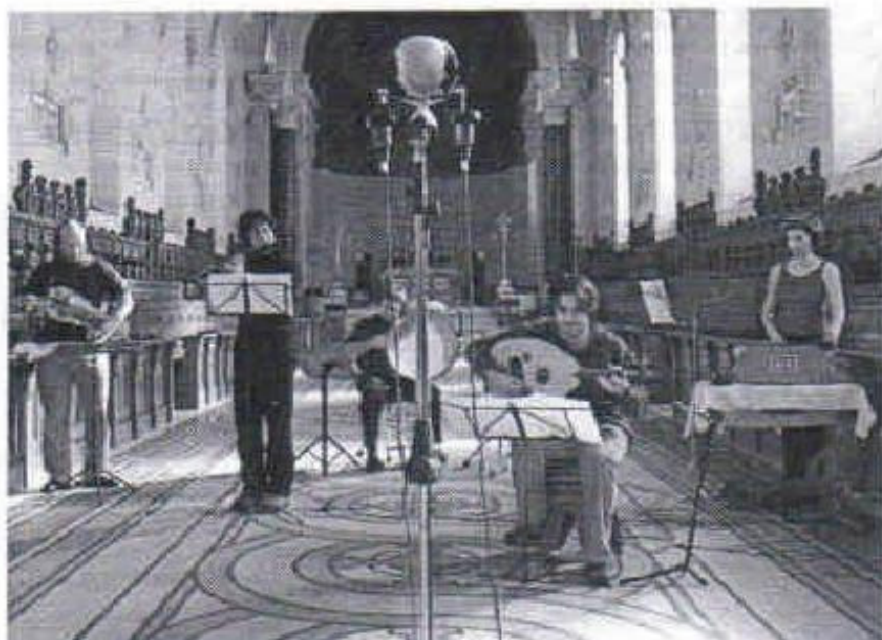
Les Jongleurs de la Mandragore durant l'enregistrement de Barbarossa , dans la chapelle du Grand Séminaire de Montréal.

Les Jongleurs de la Mandragore sortent des sentiers de la production indépendante avec leur troisième disque, mais ils entendent conserver leur indépendance d'esprit.